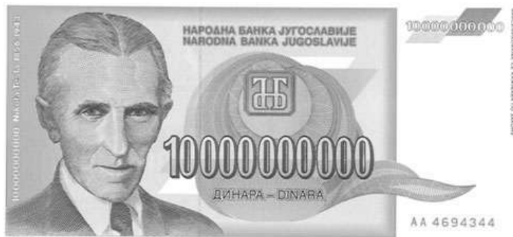
1993年 南斯拉夫 壹百億 第納爾