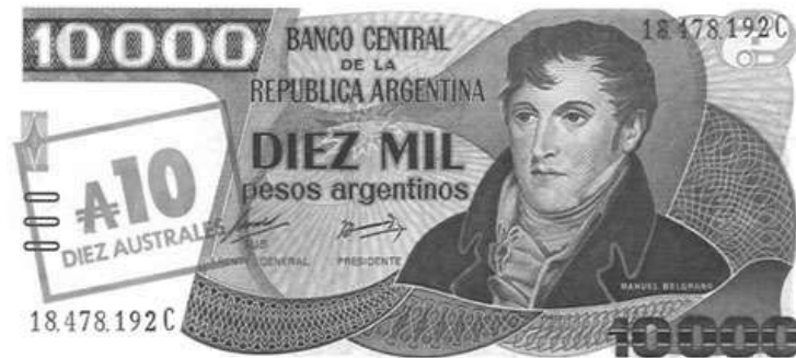
1985年 阿根廷 壹萬 披索