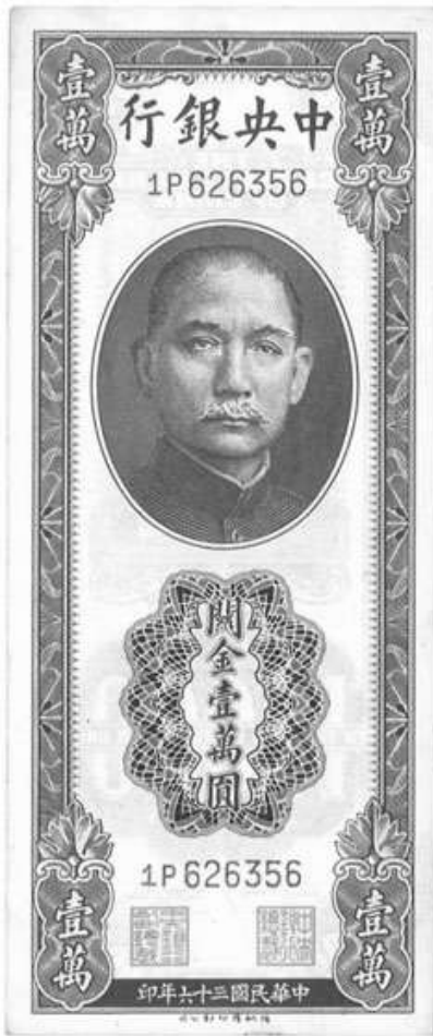
1947年 中國 壹萬元

人類在數千年前，已經利用黃金及白銀作為金錢。聖經說，黃金及白銀是誠實的價值標準，並適用於交易。他們只能透過辛勤勞動來開採，而不能從0和1的電子世界中憑空喚出。可是到了20世紀，由腐敗的人所控制的政府取消了黃金與白銀的法償地位。相反，他們都走上了通往毀滅的道路：法定貨幣，即是不能兌換成黃金，白銀或其他真正的資產，但根據政府法令而被使用的金錢。歷史上，當一個國家利用法定貨幣，其貨幣將不斷貶值，直至一文不值。這裡有一些已滅絕貨幣的例子：