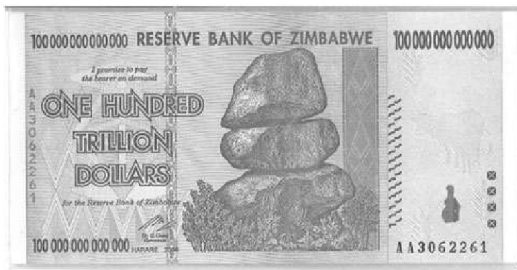
2006年 辛巴威 壹百萬億 元